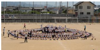
《観小 ヨッシャ 来い》練習