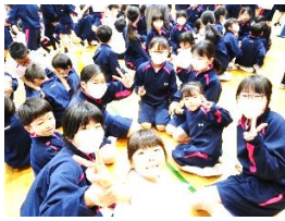
一年生を迎える会