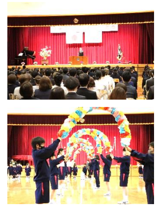
令和五年度入学式

児童会役員が企画し、六年生が準備をして、全校生参加で行った一年生を迎える会。楽しいゲームやクイズを通して、みんなが笑顔になり、仲よくなりました。 この後、一年生は二年生のエスコートで学校探検もしました。